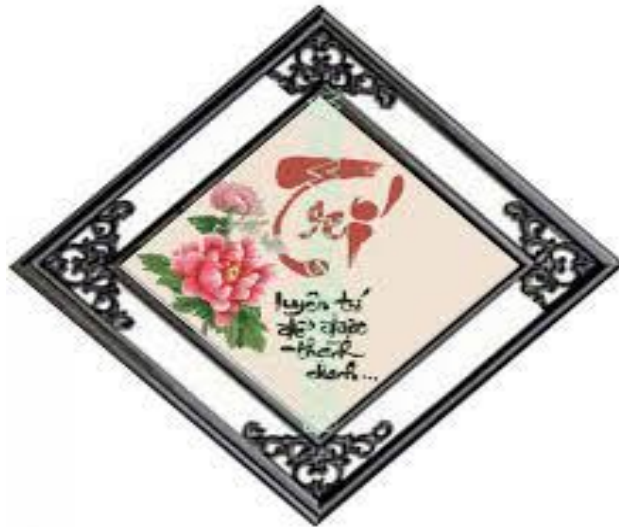
(tranh của theutay.vn)

Người đệ tử thứ ba trả lời: Người Trí là người Biết được chính mình.